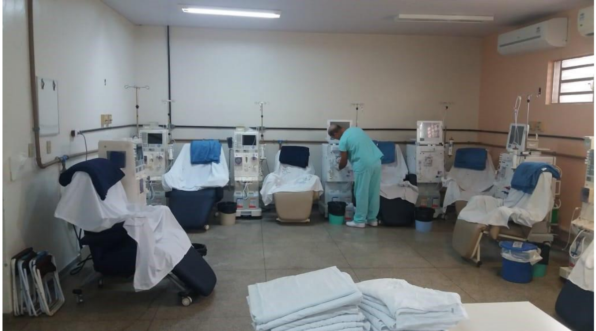
Figura 2 – Sala (branca) para tratamento de diálise em Ilha Solteira –SP