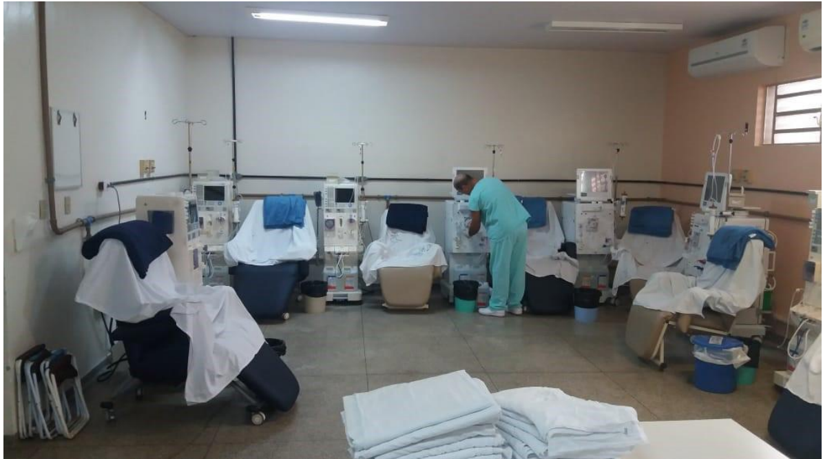
Figura 2 – Sala (branca) para tratamento de diálise em Ilha Solteira –SP