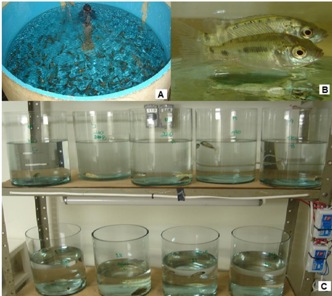
(A) Recipiente de aclimação dos peixes em sala de bioensaio. (B) Exemplares de O. niloticus com aproximadamente 1 g. (C) Recipientes teste com três réplicas por concentração do inseticida.